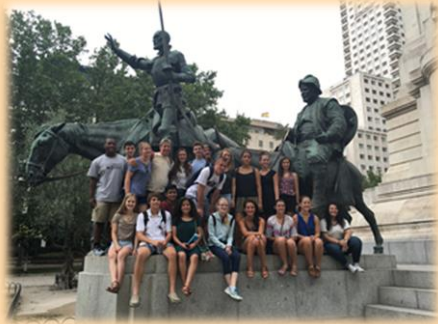
Plaza de España