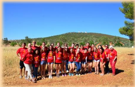
Todo el grupo delate de los molinos de La Mancha