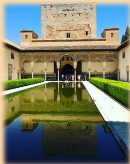
Palacio Real Group