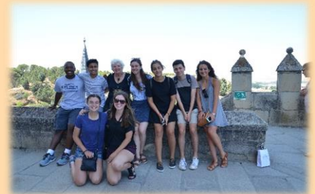
La Sra. Park con su grupo en el alcázar de Segovia