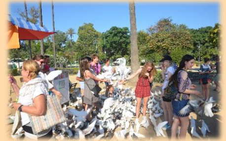
Dándoles de come a las palomitas en el parque en Sevilla