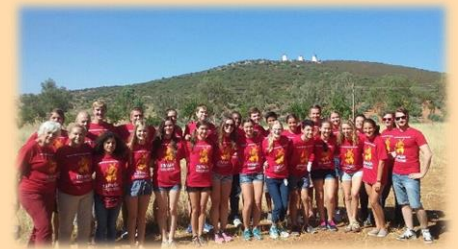
Todo el grupo delate de los molinos de La Mancha